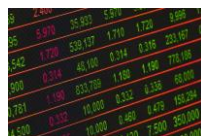
INDEX DIGITÁLNEJ EKONOMIKY