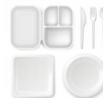
MENEJ JEDNORÁZOVÝCH PLASTOV