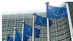
JARNÁ HOSPODÁRSKA PROGNÓZA 2018